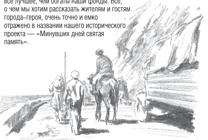
Дорога на Новороссийск. 1943 г.